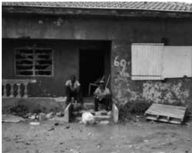
Rondhangen in Wishi/Marchena, Curaçao

en rustig. Je hebt er de zogenaamde “residentiële” wijken, waar hoogopgeleide, lichtgekleurde, welvarende mensen in mooie huizen wonen. Het is er schoon, koel en goed georganiseerd, en er worden alleen “dure dingen” verkocht in de formele plazas en winkels. De getto's van downtown Kingston worden daarentegen gekenmerkt door veel geweld en criminaliteit. Ze zijn heet, druk en ontoegankelijk voor buitenstaanders. Hier wonen de zwarte “ghetto jongeren” en arme mensen. Deze ‘hete’ plekken zijn hard aan verbetering toe. De commercie is in handen van straatventers die in de open lucht goedkope goederen verkopen. Downtown wordt ook sterker geassocieerd met misdaad, geweld en “oorlog”, hoewel de getto's ook intern worden onderscheiden naar niveau van geweld of ontwikkeling.