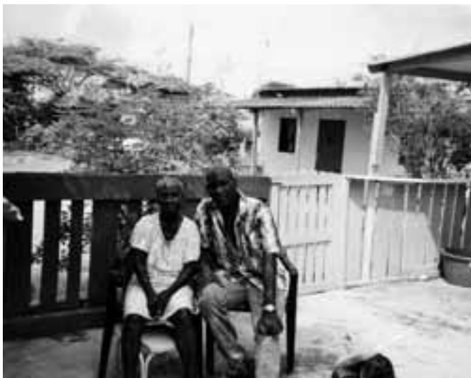
Op bezoek bij een ouder familielid in Seru Fortuna, Curaçao

tegisch ingezet in de overlevingsstrategieën van zichzelf en het huishouden, om kwetsbaarheid voor armoede of geweld en de impact van schokken (zoals economische en gezondheids crises of natuurrampen) te verminderen. Dit heeft zowel bedoelde als onbedoelde consequenties. Sociaal kapitaal kan bovendien worden verdeeld in productief of positief sociaal kapitaal, wat gunstig is voor zowel leden van het netwerk als de bredere samenleving, en beperkend of negatief sociaal kapitaal, met gunstige gevolgen voor groepsleden maar met negatieve gevolgen voor de samenleving. Het gaat dan om de sociale functionaliteit van netwerken waarbij geweld en criminaliteit zijn gemeoid, zoals gangs en drugskartels (McIlwaine en Moser, 2001).