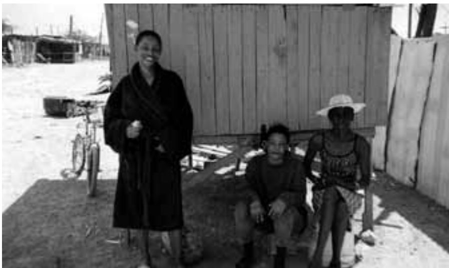
Vrouwelijke bewoners van Riverton, Jamaica

werken ontwikkeld die onmisbaar zijn in een situatie van armoede en werkloosheid. Kortom, bonding sociaal kapitaal is aanwezig. Daarentegen blijken wijkbewoners minder geslaagd in het ontwikkelen van netwerken en relaties van vertrouwen en samenwerking met bewoners in andere wijken, met andere inkomens of met een andere etnische achtergrond. Het feit dat de meeste sociale interactie plaatsvindt binnen de wijk leidt er toe dat percepties van andere groepen of wijken worden gebaseerd op stereotypes en mediareportages. Dit zwakke niveau van bridging sociaal kapitaal heeft geleid tot de bijna complete afwezigheid van grass-roots bewegingen op stedelijk of nationaal niveau. Om resultaten te behalen die actie of inbreng vereisen op een hoger dan lokaal niveau, zijn bewoners aangewezen op wijkleiders en politici, in andere woorden op hun linking sociaal kapitaal.