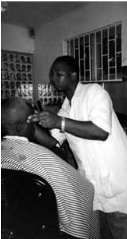
Bij de kapper in Rae Town, Jamaica

titutie en drugsverslaving. Beide steden worden afgebeeld als lappendekens waar koele, rustige, vredige stukjes worden afgewisseld met no-go zones vol problemen en geweld. Wat voor een buitenstaander één stad lijkt, functioneert voor bewoners als een archipel van wijk-eilanden, waarvan de bewoners een beperkte toegang tot elkaars gebied kennen.