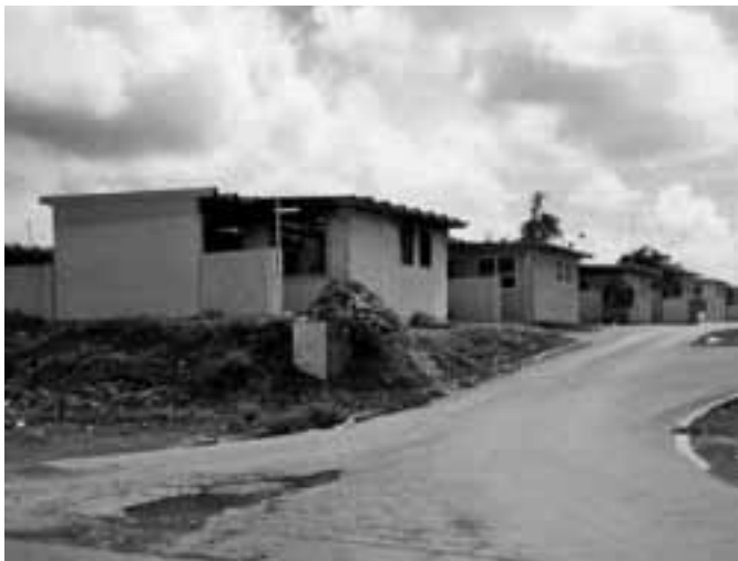
Sociale woningbouw in Seru Papaya, Curaçao

marginalisering. Terwijl geweld binnen de wijk niet altijd valt uit te sluiten, kan gelokaliseerd sociaal kapitaal wel als verklaring dienen van de tendens om misdaden buiten de eigen wijk te plegen en van het vormen van een eenheidsfront tegenover externe instituties zoals de politie.