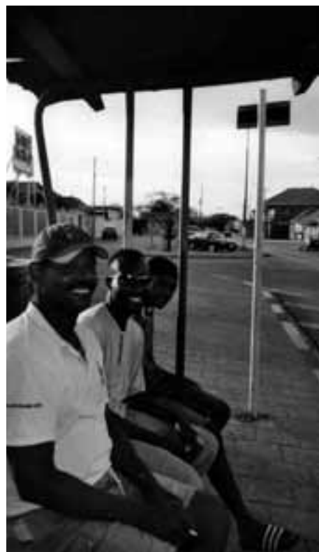
Rondhangen bij de bushalte in Wishi/Marchena, Curaçao

beschreven als aangenaam, gekenmerkt door eenheid en het weinig plaatsvinden van geweld. Jamaicaanse wijkbewoners benadrukten wel de behoefte aan ontwikkeling: meer en betere werkgelegenheid, huisvesting en onderwijs. Ook Curaçaoënaars wezen op lokale problemen als werkloosheid, een toename van buitenlanders (vooral Dominicanen), migratie van Curaçaoënaars naar Nederland, en drugshandel. Toch omschreven bewoners van Riverton hun wijk als “ the number one ghetto, top of the top ghetto ” (gettho nummer één, de beste van de beste gettho) terwijl die in Rae Town over hun wijk stelden dat “ mi love mi community - no war,