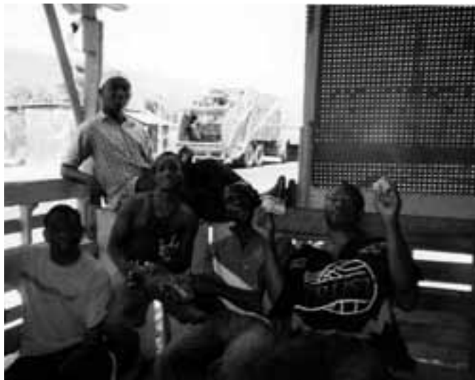
In een rumshop in Riverton, Jamaica

Bewoners in de vier onderzoekswijken waardeerden hun eigen wijk dus vrijwel zonder uitzondering heel hoog, ondanks het feit dat zij allen in gemeenschappen met zeer slechte reputaties woonden. Tegelijkertijd voelen zij zich bang of onwelkom in andere stadswijken. In beide steden is het concept van een cohesieve stedelijke eenheid, ‘Kingston Metropolitan Area’ of ‘groter Willemstad’, grotendeels afwezig. Gevoelens van identificatie met het stedelijk gebied als geheel zijn nauwelijks waarneembaar. Wat men ruimtelijk zou definiëren als één stedelijk geheel functioneert niet als zodanig voor bewoners. Eerder wordt de stedelijke agglomeratie ervaren als een aantal losjes verbonden gemeenschappen of barios, die meestal weinig fysieke of symbolische interactie kennen. Hoewel bewoners sterke wijkgebonden en nationale identiteiten vertonen, is identificatie op het niveau van de stad laag. Men ziet zichzelf niet als ‘Kingstonian’ of ‘van Willemstad’; eerder identificeert men zich met de eigen wijk of als Jamaicaan of Curaçaoënaar. Een geschiedenis van opzettelijke segregatie gebaseerd op etniciteit, klasse en politieke achtergrond, gecombineerd met de