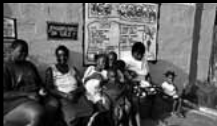
Voor een winkel in Rae Town, Jamaica